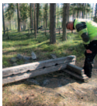
Jartsa tutkimssa jalkapuita lentiirassa