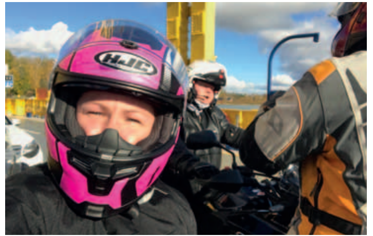
Eka kerta lossilla (MH)