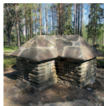
Kirveskansan kirkon pienoismalli