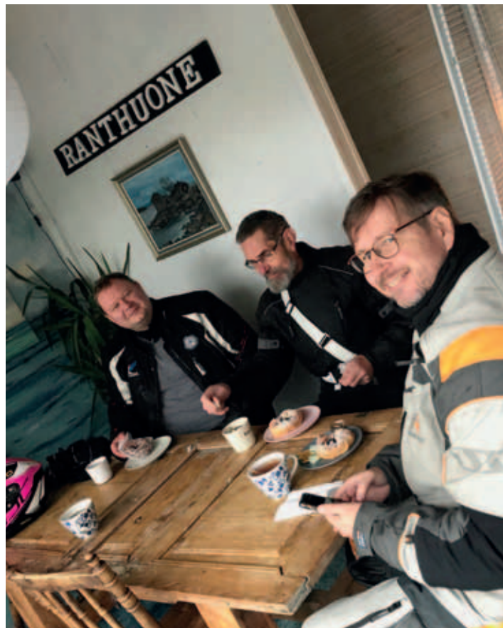
Kahvilla vesi- ja räntäsadetta suojassa Kustavissa 2020.

Mikäli kaipaa ajoseuraa niin muista kerholaisista sen saaminen on melko taattua, kun sitä vain rohkenee kysyä. Välillä kerholaiset ajelevat pienemmässä, välillä isommassa porukassa. Virallisena porukka-ajeluna toimii ns. tiistai-ajelut, jotka ovat vastuuhenkilön vetämiä ja suunniteltuja. Niihin voivat osallistua myös kerhon ulkopuoliset. Ajeluissa otetaan aina jokainen huomioon, joten vähäiselläkin ajokokemuksella on erittäin tervetullut mukaan. Muilta kerholaisilta saa halutessaan apua, tukea ja neuvoja.