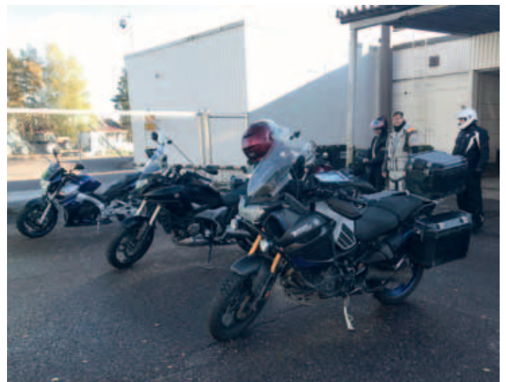
Kokoontuminen kämpillä (MH)

Angelniemestä Kemiöön menevä tie on alkupäästä moneen kertaan urapaikattu, mutta hyvin ajeltavissa, kunhan jättää nopeuden ahnehtimisen paremmille pätkille.