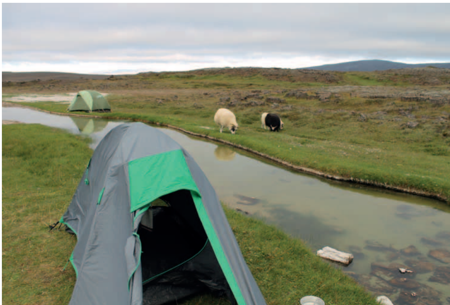
Hveravellir aivan keskellä islannin aavikkoa, terminen puro

Jökulsárlónin jälkeen oli aika siirtyä Reykjavikiin, mutta pyhien ja muiden vapaiden aikana jatkoin Reykjavikin lähitöillä oleviin seutuihin tutustumista ja pitimmillä ajomatkoilla myös tutustumista Snæfellsjökulliin ja Langjökulliin. Viime mainitun huipulle pystyi jopa ajamaan, jos uskalsi ohittaa kaikki pääkallosymbolit ja hengenvaarasta kertovat varoitukset. Ajoin tietenkin ylös jälle voidakseni todistaa ajaneeni moottoripyörällä jäätiköllä!