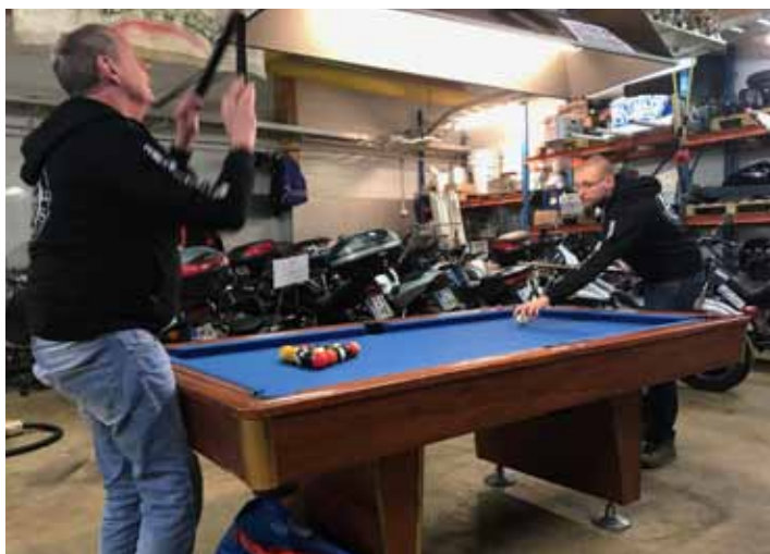
Talvikaudella ajanviettoa kerholla muiden kerholaisten kanssa.

Kerhosta löytyy varmasti jokaiselle jotakin. Kerhon mottona toimii ”Osallistu, vaikuta, viihdy”. Jokainen jäsen on tärkeä osa kerhoa ja jokaisella jäsenellä on mahdollisuus olla vaikuttamassa siihen millainen kerho TuMP on. Ilman jäseniä ei ole kerhoa.