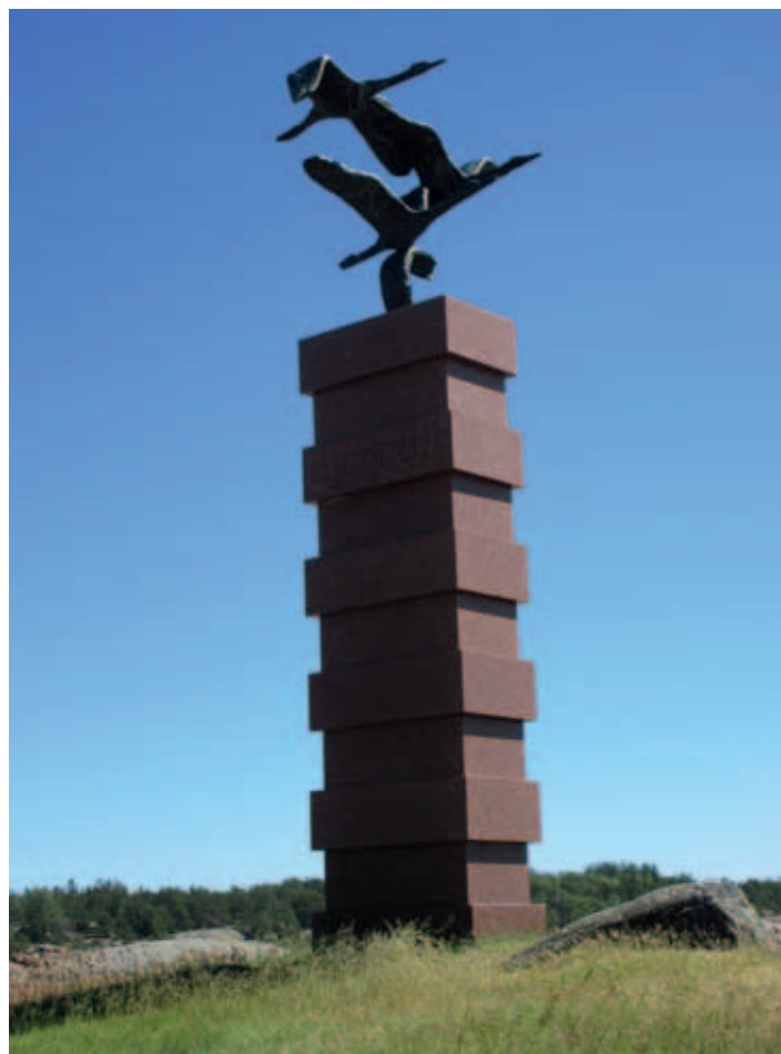
1880-luvulla siirtolaisena Yhdysvaltaan menneiden muistomerkki