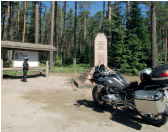
Täällä Mannerheim otti vastaan Hankoniemen vapautusparaatin.

Sitten olikin vuorossa itse vuonna 1874 perustettu Hangon kaupunki, jota ympäröi meri kolmelta puolelta. Ajamme niin pitkälle eteläkärkeä kuin mahdollista kunnes satama-alue estää etenemismme. Periaatteessa täältä keskusta on noin 2 km matka on pientaloasutusta eli Hanko ei ole mikään kerrostalo kaupunki. Merenkulku on näytellyt aina merkittävää osaa matkailun lisäksi kaupungin historiassa.