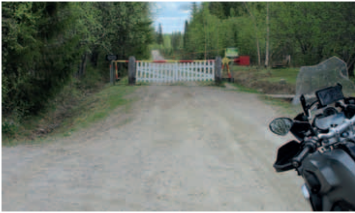
Raatteentie päätty tähän