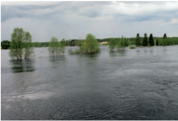
Kohtasimme lapin tulvat