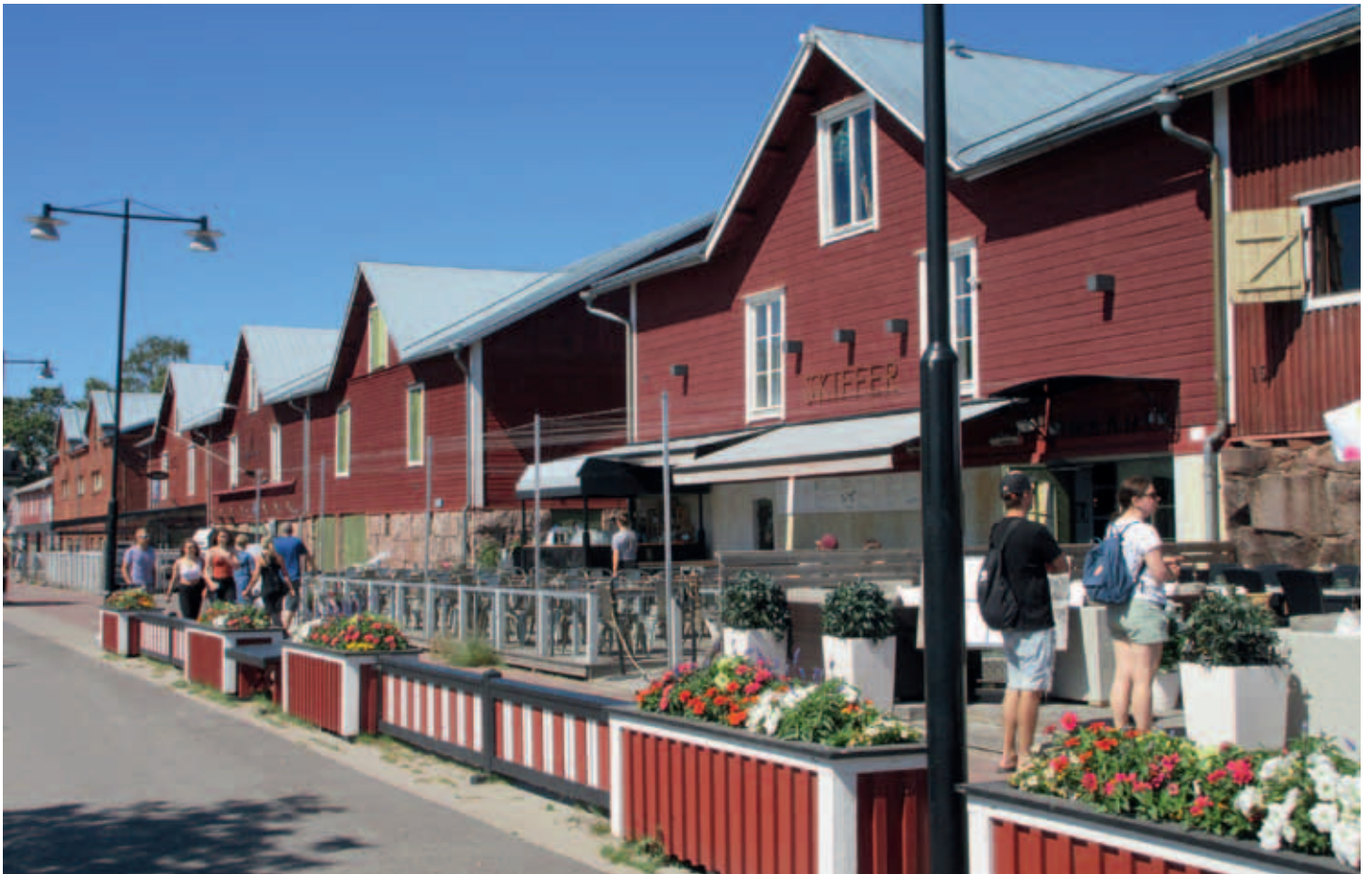
Korona oli karkoittanut terassivieraat Hangon satamassa.