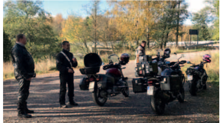
Parkissa Strömmalla (MH)