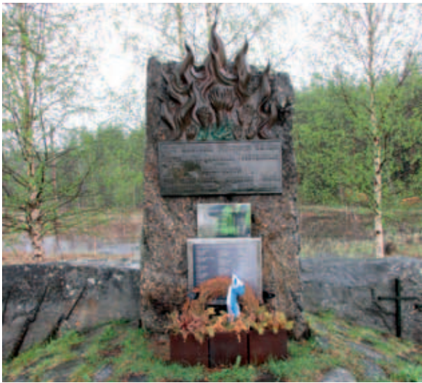
Partisaanien uhrien muistomerkki kouskussa

kansamusiikkiyhtyeestä Angelin tytöt. Angelista tietä 9553 lähdimme kohti Inaria. Sade oli loppunut, mutta vastaavasti oli tulvan vesimassat vallanneet suuret alueet metsiköistä ja lähentelivät meidänkin käyttämämme tien 92 tienpientareita. Inarissa oli majoituksemme kylän keskustan tuntumassa olevassa mökkikylässä. Vuokraamamme mökki oli lähes uuden karhea. Ulkona tuli taivaalta vettä kuin saavista kaataen. Pyörien sivujalan alle oli laitettava kunnon aluslevy, koska vain se estäisi jalan painumasta syvälle maahan ja pyörien kaatumisen. Vesilätäkö mökkimme edessä oli parhaimmillaan nilkkaan saakka. Huolsimme varusteitamme ja hie-man suurempi mökki suuremmin kuivatustiloin ei olisi ollut yhtään pahitteeksi. Lopulta sade loppui alkuillasta ja näin oli ilman sateenvarjoja helppo lähteä tutustumaan Inariin.