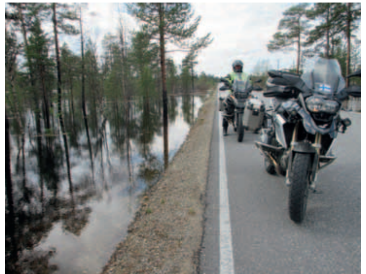
Vesi lähes vallannut ajotien

Ilmojen haltijat olivat puolellamme herätessämme. Sää suorastaan kutsui meitä tien päälle ja lähdimmekin heti aamiaisen jälkeen. Ensimmäisinä ajotunteina koimme Lapin lukuisat talvimatkailukeskukset tuntureineen. Ensimmäisenä oli vuorossa Olos, jonne Muoniosta oli vain 5 km. Seuraavana listallamme olivat Ylläksen Äkäslompola ja Ylläsjärvi. Ylläksen lomakohteita Äkäslompoloon yhdistää 15 km pitkä maisematie. Tien pätkällä oli taukopaikka, jonne oli vanhalla matkailuautolla kaksi pariskuntaa jymähtänyt paikalleen. Lomamatkalle hankitun matkailu-auton hankintahinta oli ollut edukas, mutta laatu jo pääl-