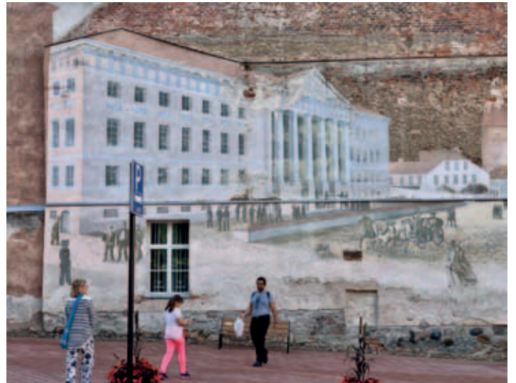
Seinämaalaus - yliopisto