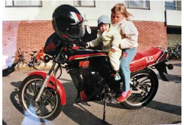
Minä ja pikkuveli isoveljen pyörän kyydissä.

Kortin ajamisen ja moottoripyörän hankkimisen lisäksi jostain heräsi ajatus liittymisestä moottoripyöräkerhoon. Taisin ajatella, että kerhot ehkäpä järjestävät jotain kursseja ja saisin apua moottoripyörään liittyvissä asioissa. Googlailin eri kerhoja Turun seudulla ja silmiini osui Turun Moottoripyöräilijöiden nettisivut. Nettisivujen perusteella kerho vaikutti hyvältä ja kaiken lisäksi sijainti oli itselleni aivan loistava. Kerhotoiminta ei ole tuntunut omimmalta ja emmin kauan ennen jäsenhakemuksen lähettämistä. Jokin sanoinkuvaamaton veto TuMPissa kuitenkin oli, eikä sekään jättänyt rauhaan. Joten pakkohan se oli kerhoon liittyä. Onneksi liityin, vaikka se jännittikin, sillä jo lyhyen ajan sisällä kerho antoi itselle todella paljon.