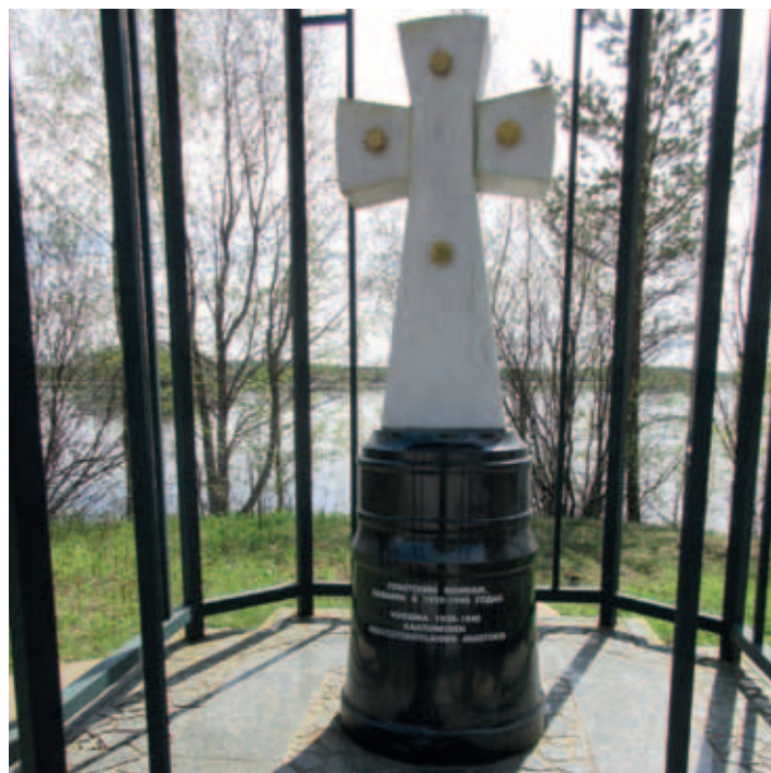
Venäläisten muistomerkki saunajärvellä

Heräsimme jälleen aurinkoiseen ja lämpimään aamuun. Hotellin aamiainen toimitettiin valmiina annoksena pöytiin asiakkaille. Syynä oli korona tietysti. Ensitöiksemme emme lähteneetkään kohti Suomussalmea vaan ajoimme Kekkostien, tie 900, alkuun ja siellä olevalle Kekkostien muistomerkillle. Urho Kekkoson ollessa pääministeri 1950-luvulla hän käynnisti useita tiehankkeita työttömyyden voittamiseksi. Osittain myös tuolloin käytettiin vankeja tietöissä ja vankityövoimamäärärahoilla oli rahoitus järjestetty tänne Kainuuseen. Navigaattori ohjasti meidän helposti muistomerkeille. Jatkaessamme kohti tulevaa reittiämme tietä 912 ulos Kuhmosta oli tien pinta jo niin lämmin auringonpaisteesta, että liikenneympyröissä tien asfalttipinnan läpi tihkui jo öljyä raskaiden ajoneuvojen alla. Ympyrät olivat näin erittäin petolliset kaksipyöräisille.