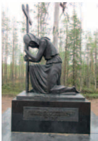
Venäläisten muistomerkki raatteen tiellä

Kahvit tarjottiin mahdottoman isolla leivoksella ja myynnissä itse kaupassa oli vaikka mitä. Ehdoton