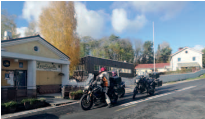
Palaveri Lossirannassa (OL)