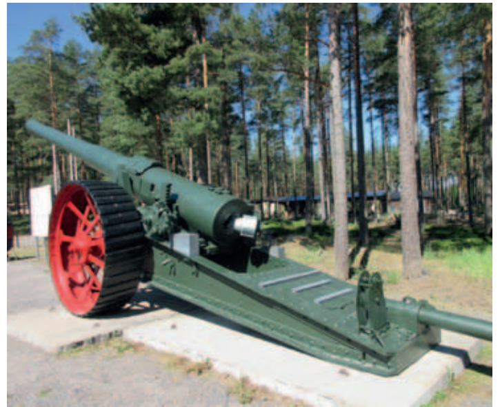
Järeää kalustoa rintamamuseossa