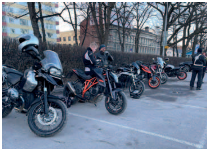
Ajokauden 2021 aloitusta kerhon jäsenten kesken